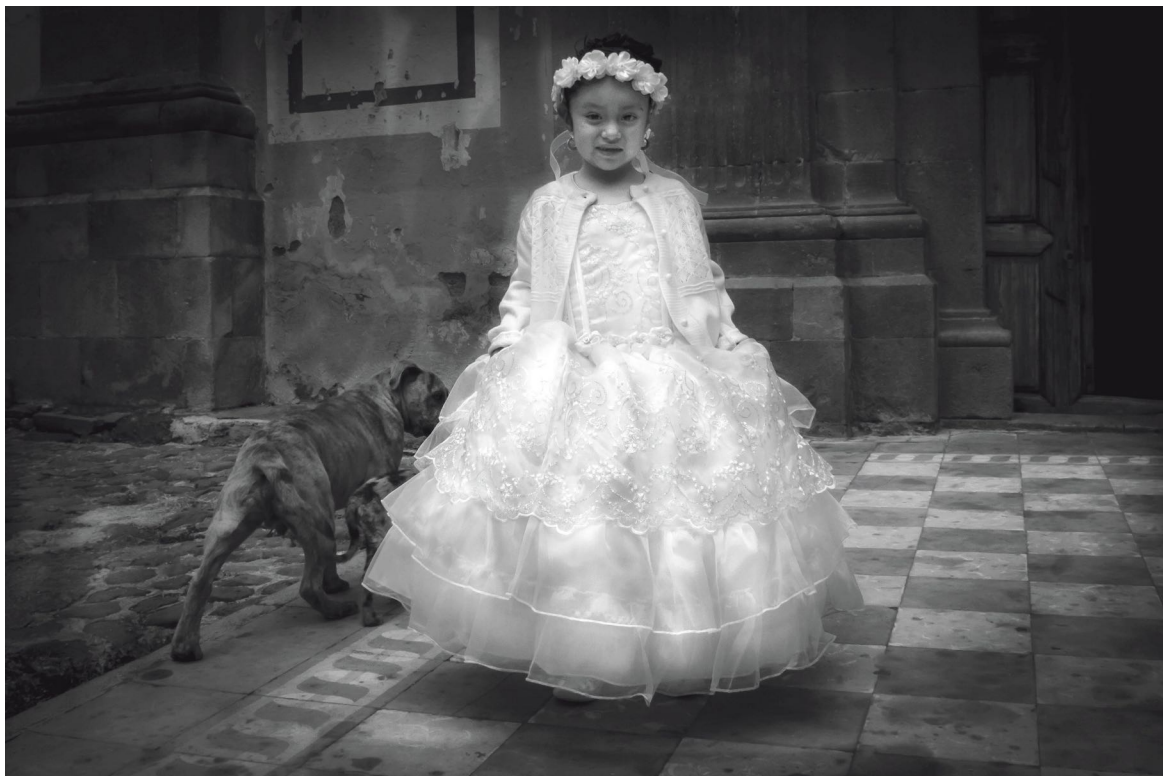
Primera comunión con perro Santa Fe de la Laguna, Michoacán 2022