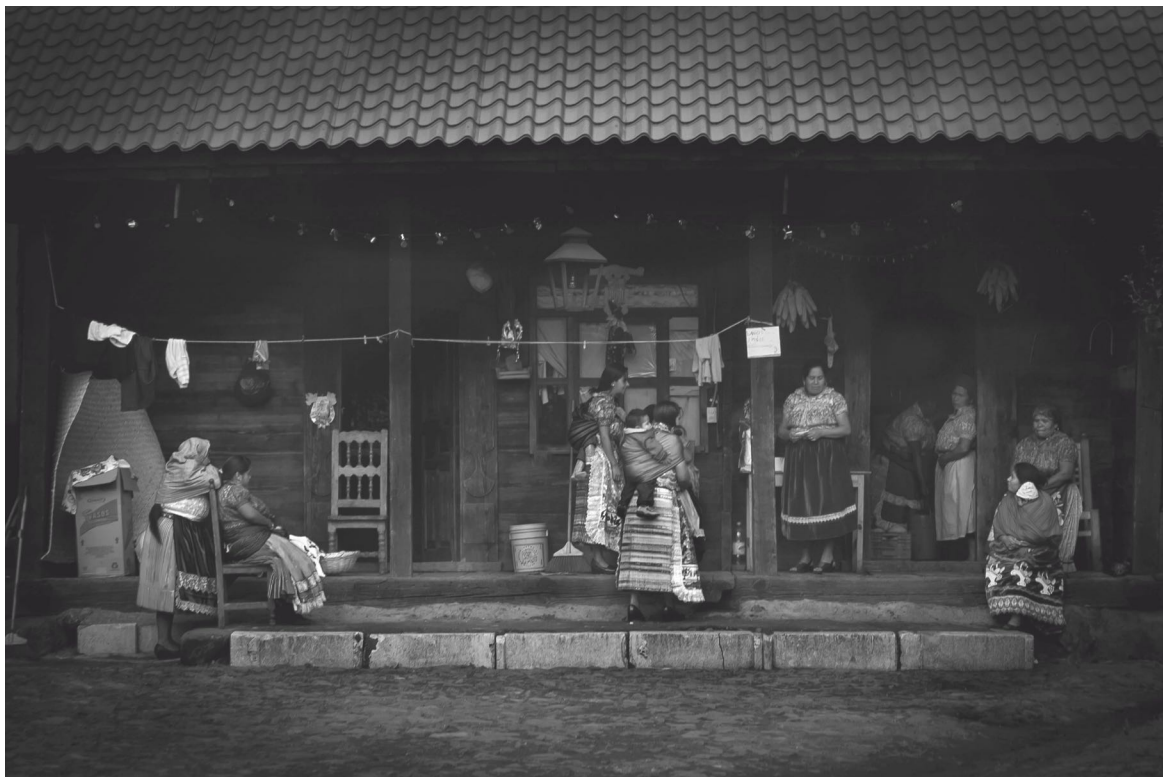
La espera Angahuan, Michoacán 2021