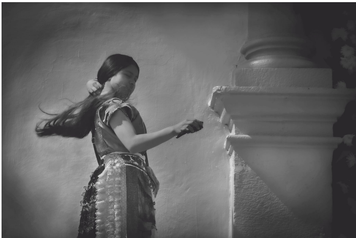
Al aire Angahuan, Michoacán 2023