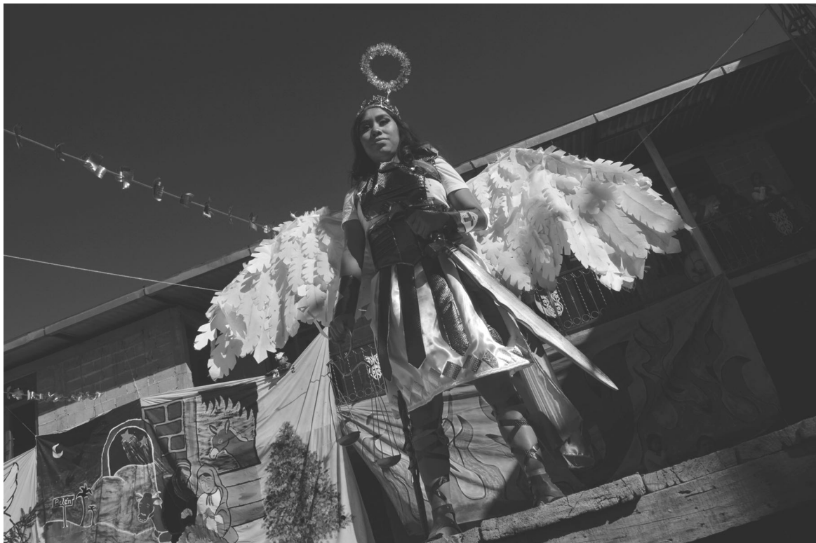
Ángel exterminador Cheranástico, Michoacán 2021